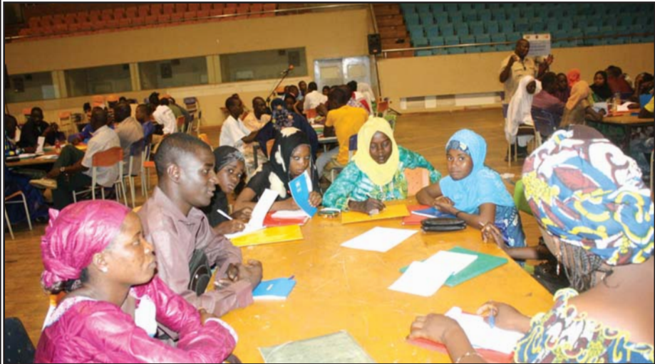
Les jeunes en café mondial...