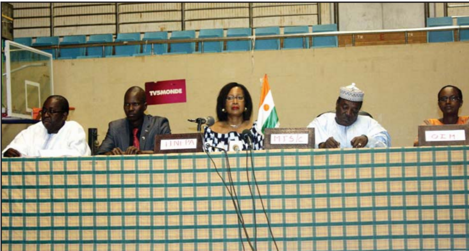
La table de séance à l'ouverture du forum