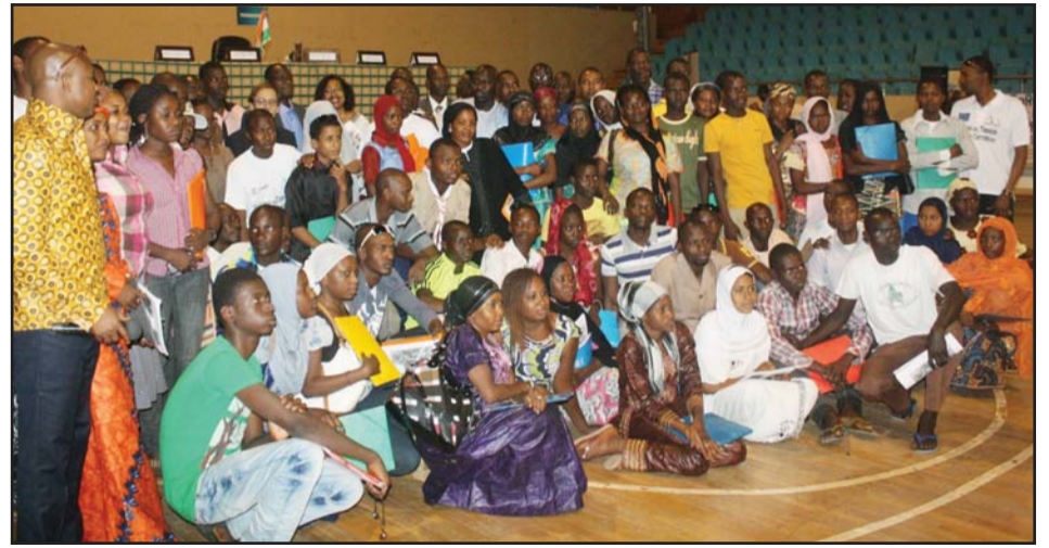
Photo de famille des participants