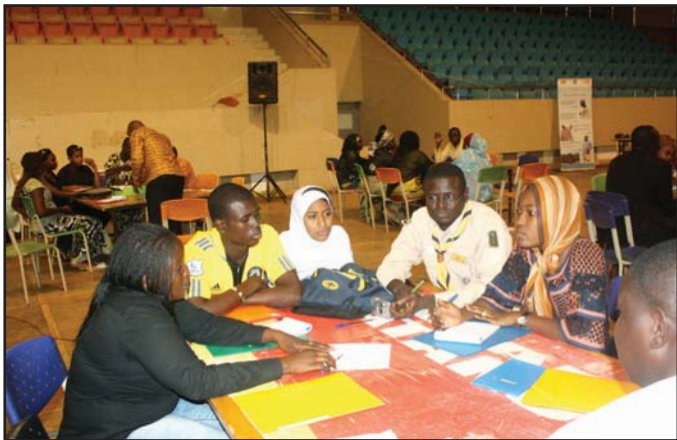
... échangeant sur les thématiques

tentative pour obtenir un acte sexuel, commentaires ou avances de nature sexuelle, ou actes visant à un trafic ou autrement dirigé contre la sexualité d'une personne par la coercition... ; les violences physiques tels que les coups et blessures, la séquestration, et autres brutalités physiques ; les agressions physiques, comme le fait de